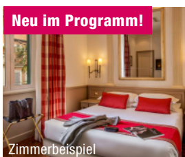
Neu im Programm!